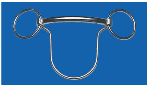
貼顎型防斜跑口銜鐵