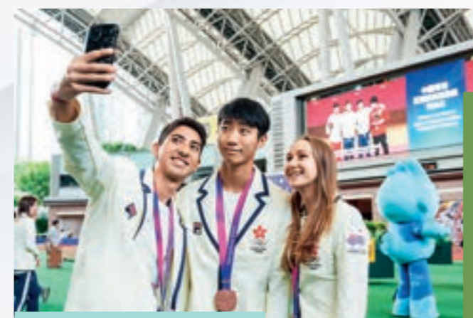
一眾運動員出席「中國香港亞運獎牌運動員賽馬日」，與公眾共慶凱旋。