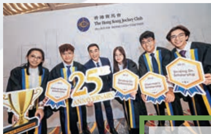
香港賽馬會主席利子厚（左三）與應屆畢業的賽馬會學人合照。