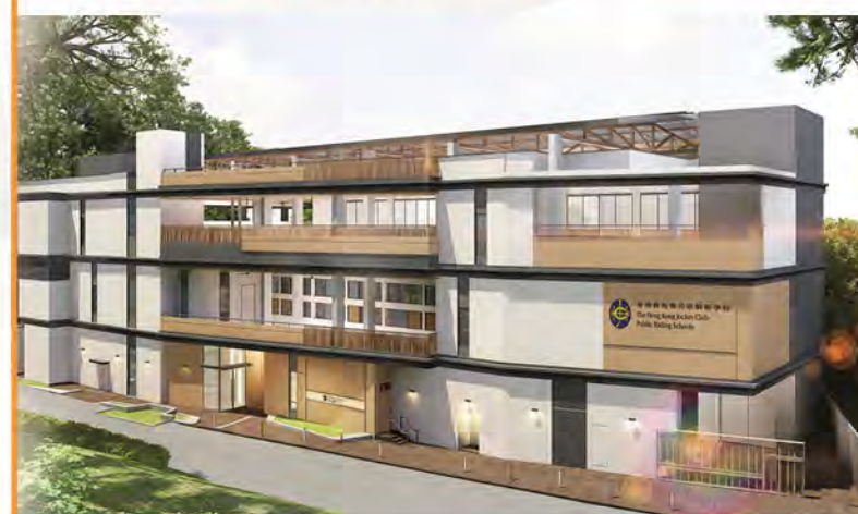
薄扶林公眾騎術學校新面貌概念圖