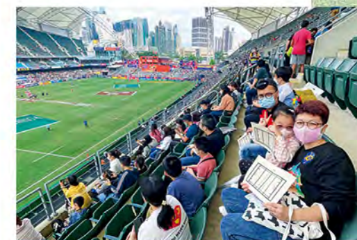
1 在賽馬會「開聲體」體育口述影像服務安排下，視障人士有機會入場「觀看」香港國際七人欖球賽。

隨著疫情過去，不少國際體育盛事都恢復舉辦，我希望可以把體育口述影像帶到更多不同類型的項目，把「體育面前人人平等」的精神推廣到社會不同階層，令更多視障人士享受到體育的樂趣！