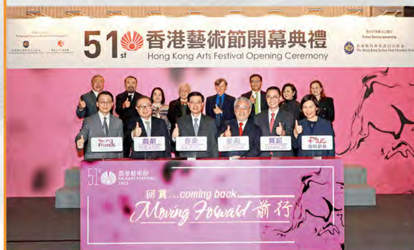
行政長官李家超（前排左三）、文化體育及旅遊局局長楊潤雄（前排右二）、康樂及文化事務署署長劉明光（前排左一）、馬會董事廖長江（前排左二）、香港藝術節主席查懋成（前排右三）及行政總監余潔儀（前排右一）為藝術節主持開幕禮。

第 51 屆香港藝術節圓滿結束，這項由馬會一直大力支持的文化盛事，今年以「回賞・前行」為主題，深受歡迎。當中包括「香港賽馬會藝萃系列」一舞蹈節目《收音機與茱麗葉》及《春之祭》、歌劇《尤利西斯歸鄉記》及音樂演出《天葬》等。