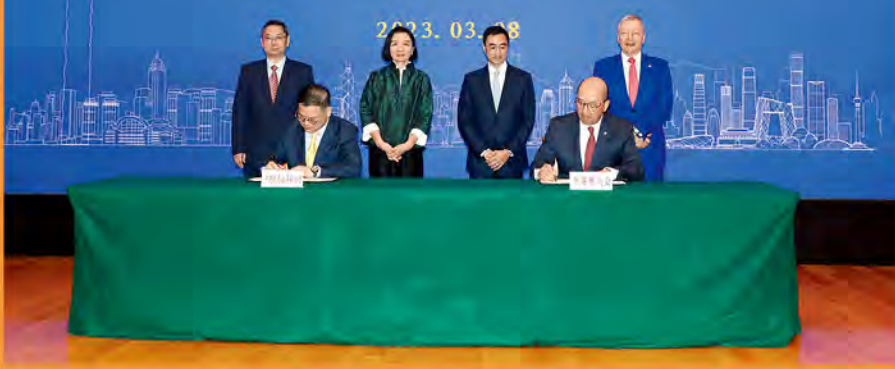
在中聯辦副主任盧新寧（後排左二）、中聯辦青年工作部副部長宋來（後排左一）、馬會主席利子厚（後排右二）、行政總裁應家柏（後排右一）的見證下，中聯辦宣傳文體部副部長張國義（前排左）與馬會公司事務執行總監譚志源（前排右）代表雙方簽署合作協議。

馬會主席利子厚、行政總裁應家柏及公司事務執行總監譚志源，早前拜訪中央人民政府駐香港特別行政區聯絡辦公室（中聯辦）副主任盧新寧，雙方簽署了《中聯辦 - 香港賽馬會體育及文化藝術交流活動》及《中聯辦 - 香港賽馬會「實踐科創·探知歷史」內地實習與交流計劃》合作協定。