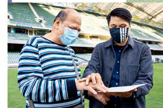
3 除了用耳機收聽口述影像員的描述，入場的視障人士亦可以用觸感紙了解球場及球員資料，增加投入感。

如欲了解更多賽馬會「開聲體」體育口述影像服務，可到 YouTube 頻道觀看影片 https://bit.ly/3rxu4UO