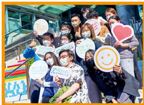
「賽馬會專業創未來計劃」協助畢業生投身職場。

計劃現進入第三期招募階段。一經取錄，參加者將獲為期一年的全職有薪見習機會，並獲安排職前特備訓練營及全程職涯輔導，提昇由學校過渡到職場的就業能力，為社區作出貢獻。