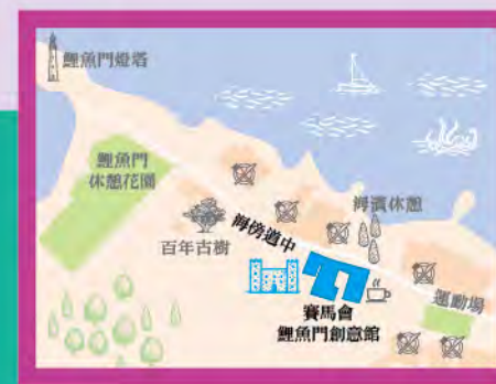
圖 1