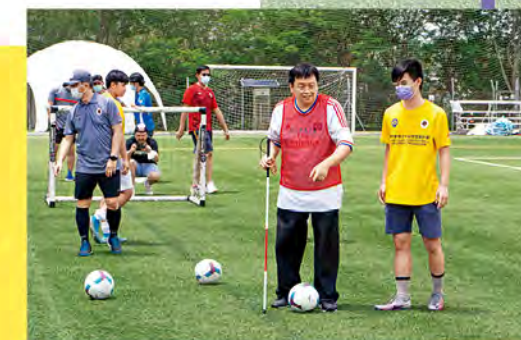
2 賽馬會青少年足球發展計劃亦與「開聲體」合作，安排青少年足球隊成員帶領視障人士體驗足球運動。