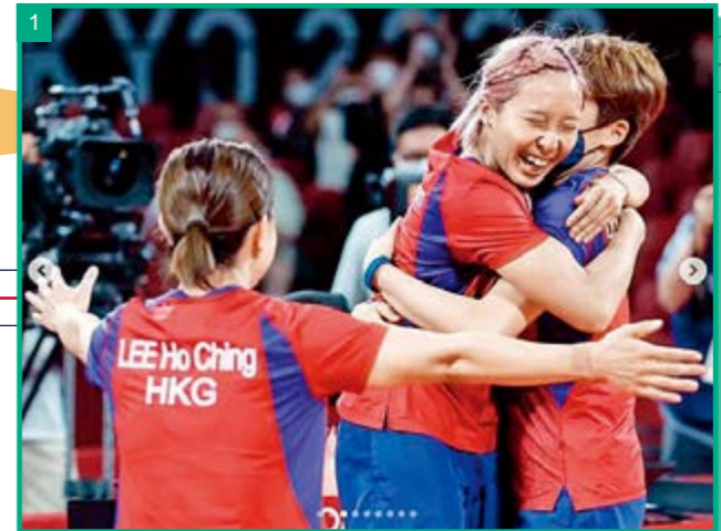
1 銅牌戰勝利一刻，真摯的擁抱成為她們最珍貴的奧運回憶。