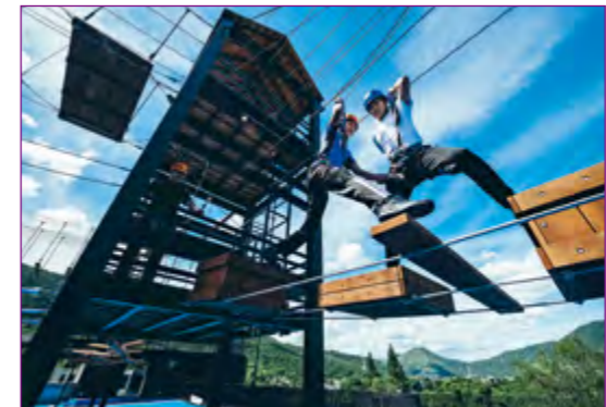
重建後的訓練營，為使用者提供優化的設施及創新的運動項目。