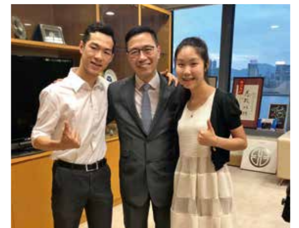
兩個高中同學於暑假期間成為政府司局長的「工作影子」，伴隨局長工作一日。