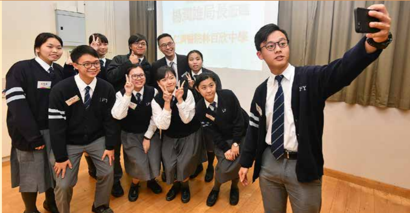
到訪中學與學生「自拍」

●●成績代表你某年某月某日在一些事上的表現，成績好與壞，對前途有影響，但非決定你的未來；可能你因而行了第二條路，但一樣會成功。●●