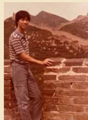
大學時期趁暑假到北京旅遊