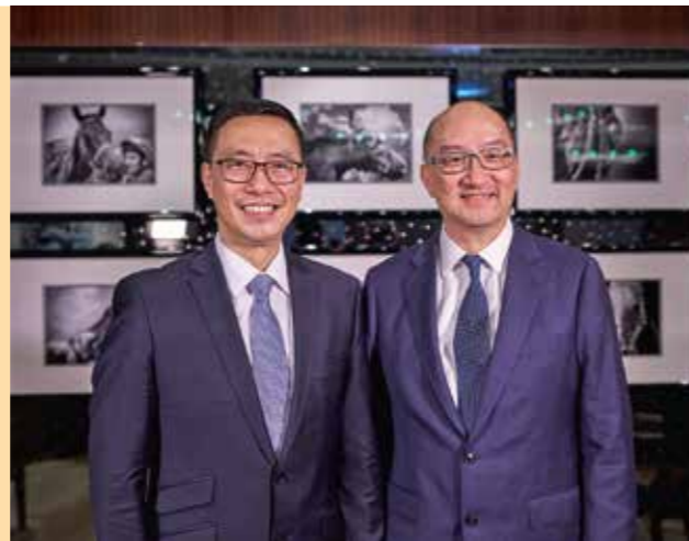
前任政制及內地事務局局長、現任馬會公司事務執行總監譚志源（右）擔任今期《駿步人生》客席主持。