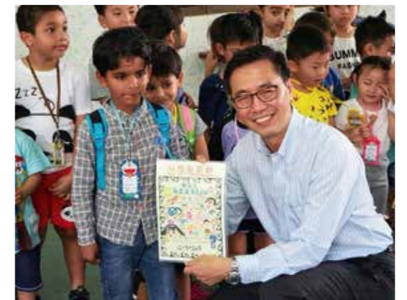
去年5月探訪幼稚園，非華語學生向他送上手繪圖畫留念。