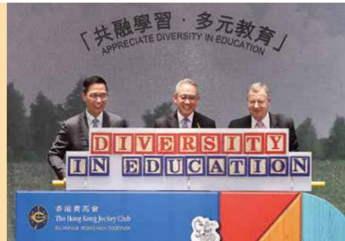
今年5月出席「香港賽馬會社群盃」活動，與馬會主席周永健博士（中）及馬會行政總裁應家柏（右）擔任主禮嘉賓。

面對環境轉變，楊潤雄認為大灣區是國家未來的發展策略，包括發展成為國際創科中心，是一個大機遇；若要嘗試行這條路，先要熟習環境，抱持開放態度多了解和交流：「每個人都有自己的長處，大可在大灣區利用新科技發揮出來。」要把握機遇，認為學校可以多舉辦交流活動，例如配對姐妹學校，讓兩地學生作長遠的接觸；或舉辦交流團，參觀科技創意基地，讓學生親身體驗，加深了解。