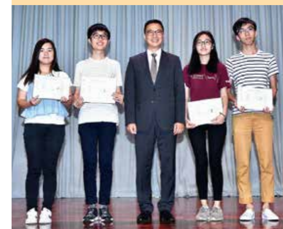
年前到訪學校勉勵中六放榜同學