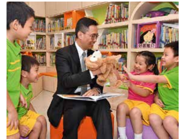
探訪幼稚園，為小朋友說故事玩遊戲。

就是由政務主任到成為問責官員、由副局長到成為局長，他說最初都有點猶豫，但想著，機遇來了就努力把握，接受挑戰吧，心反而寬了：「教育有好多敏感議題，感受壓力好大，唯有調節自己心態。」只有認清事件的本質，面對攻擊也就能處之泰然。為減壓，他說工作再忙都堅持一星期做一次運動，不過最重要的，還是家人的支持。